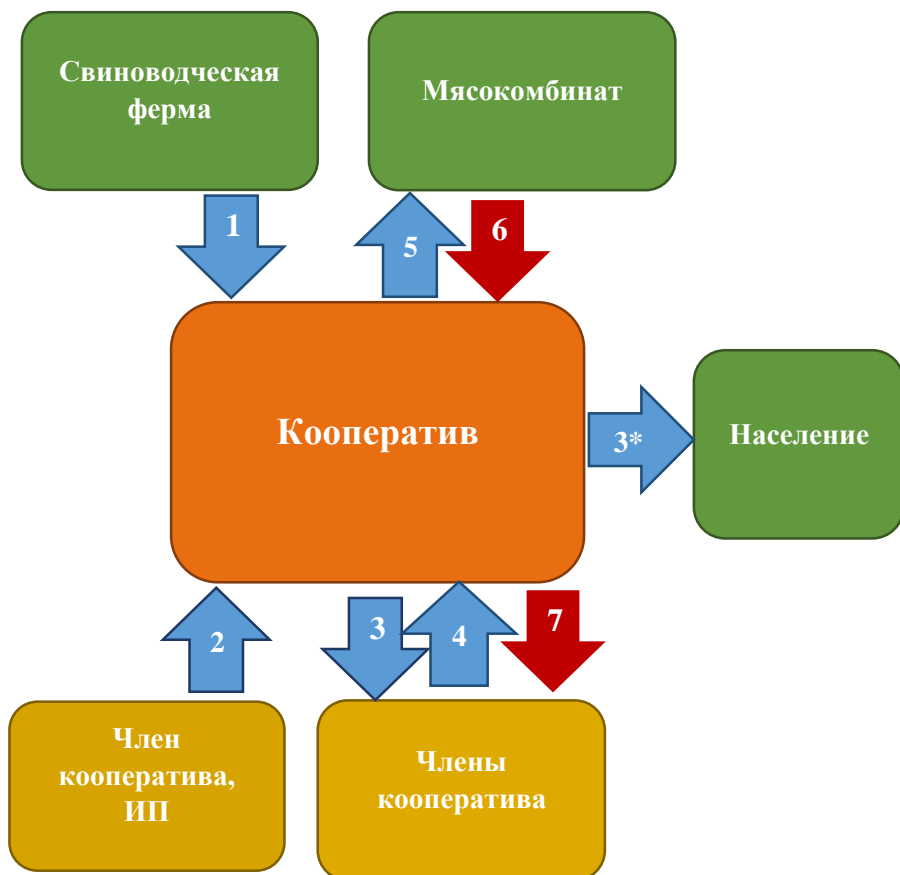
Схема работы кооператива

1. Кооператив закупает у свиноводческой фермы молодняк свиней и оплачивает его.